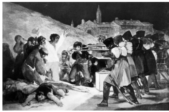
* pintor: 화가

A: ¿De dónde es el pintor? B: Es español. A: ¿De qué siglo es la pintura? B: Es del siglo XIX. A: ¿De qué trata? B: De la guerra entre España y Francia. A: ¿Dónde podemos verla? B: En el Museo del Prado.